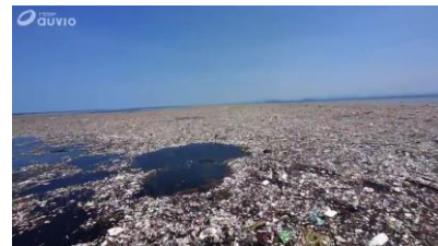
mer des Caraïbes

La Fondation Ellen Mac Arthur prévoit que, si rien n'est fait, la masse de plastique dans les océans sera supérieure à celle des poissons en 2050.